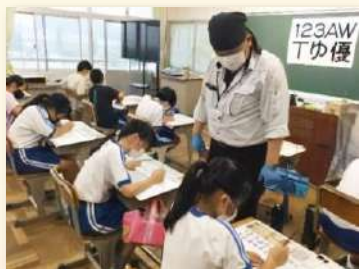
① 小学生の表札作り体験 （広告美術仕上げ職種）

「小中学校などの児童・生徒」や、「地域若者サポートステーションの支援対象となる方」へ、「ものづくりの魅力」を伝えます。体験することでものづくりへの興味を喚起し、マイスターの製作実演や講話で、マイスターの仕事や、体験した技能が仕事の中でどう活かされているかなどを学びます。