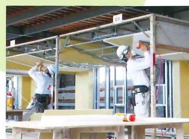
ボード仕上げ作業技能検定試験風景