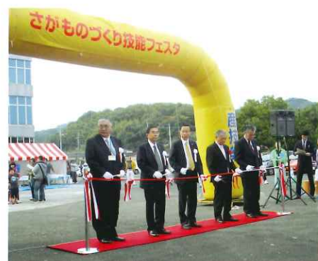
さがものづくり技能フェスタ・オープニングの様子