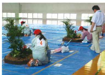
室内園芸装飾作業3級技能検定試験風景