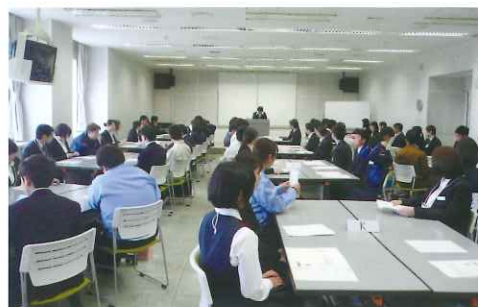
新入社員研修の様子